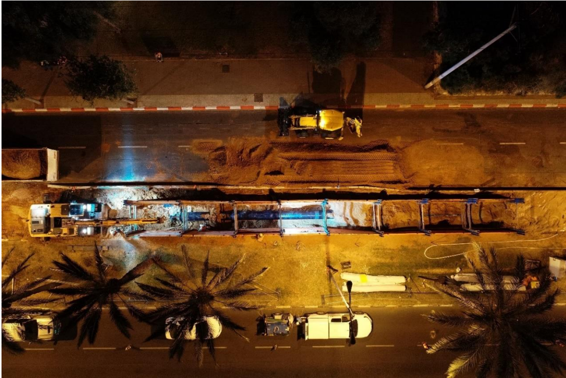
עבודות בדרך משה דיין, קו מגיסטרלי 30"